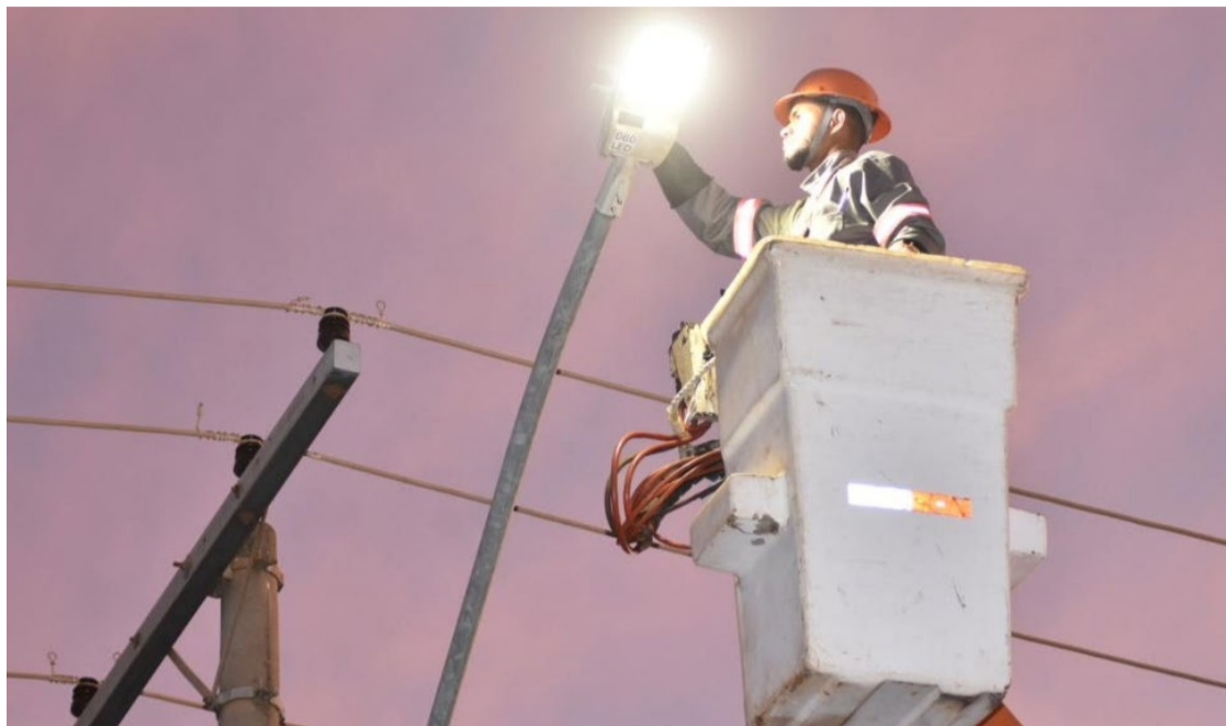
Troca de lâmpadas de sódio por modelos de LED começou na região Noroeste no início da semana

Antes da contratação do consórcio, a própria Seinfra começou o trabalho de eficien-