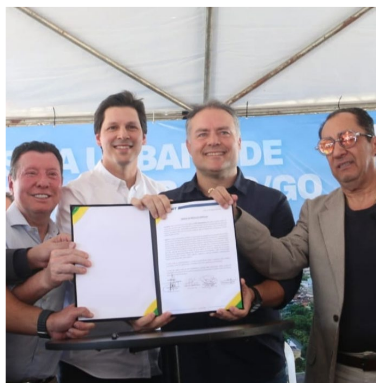
Vice-governador Daniel Vilela e Renan Filho: assinatura de ordem de serviço para obras rodoviárias no trecho urbano da BR-020

A construção dos viadutos teve início em 2020 e foi finalizada em 2022. O ministro Renan Filho assegura que, desta vez, não haverá interrupções. “O projeto-executivo já foi finalizado; as obras serão retomadas imediatamente”, afirmou.