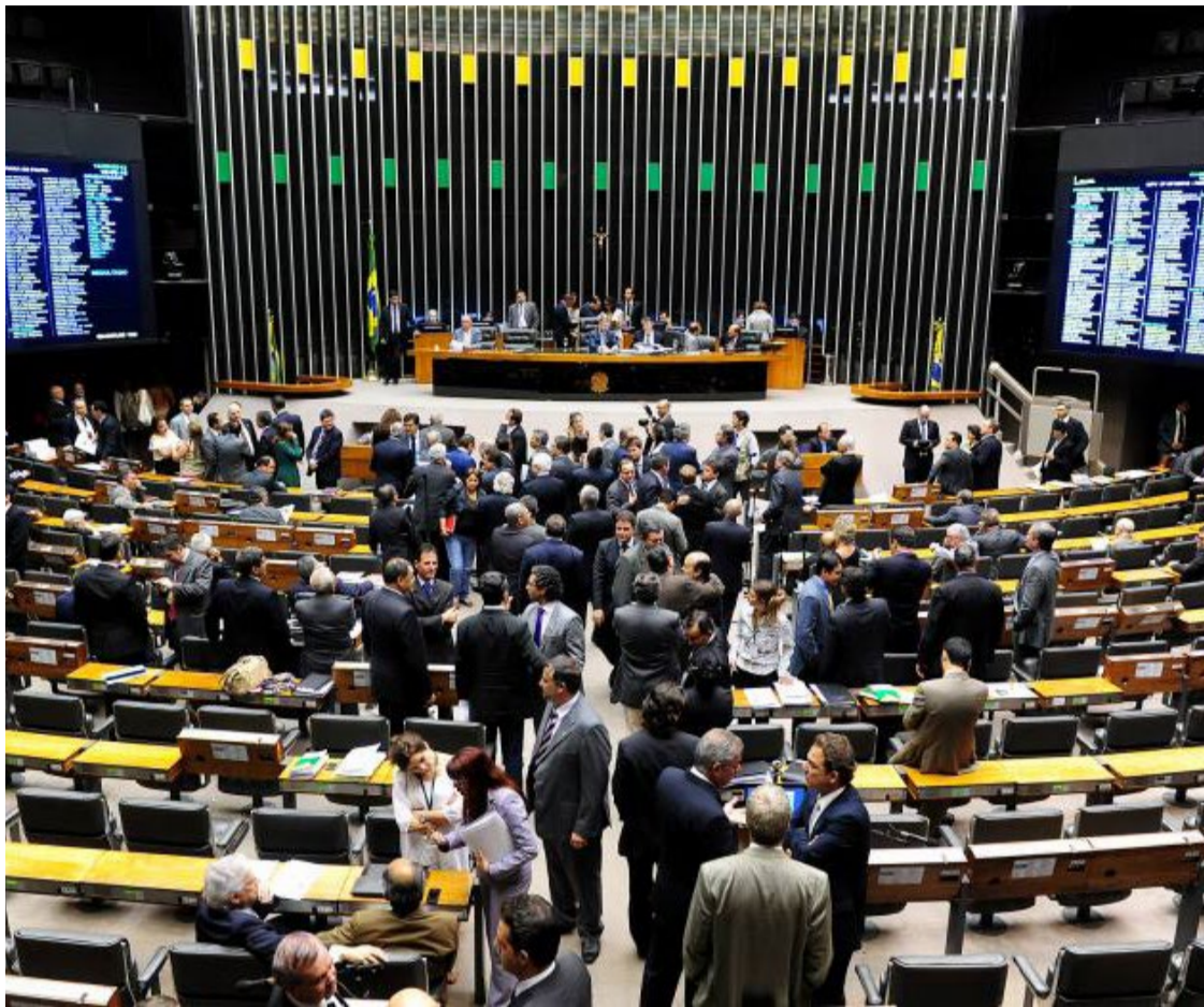
Senadores e deputados federais vão conciliar atividades em plenário com campanhas eleitorais

Padilha voltou a defender o aumento da CSLL (Contri- buição Social sobre o Lucro Líquido), tributo que incide sobre o lucro das empresas, para ajudar a compensar o impacto estimado em R$ 17,2 bilhões neste ano.