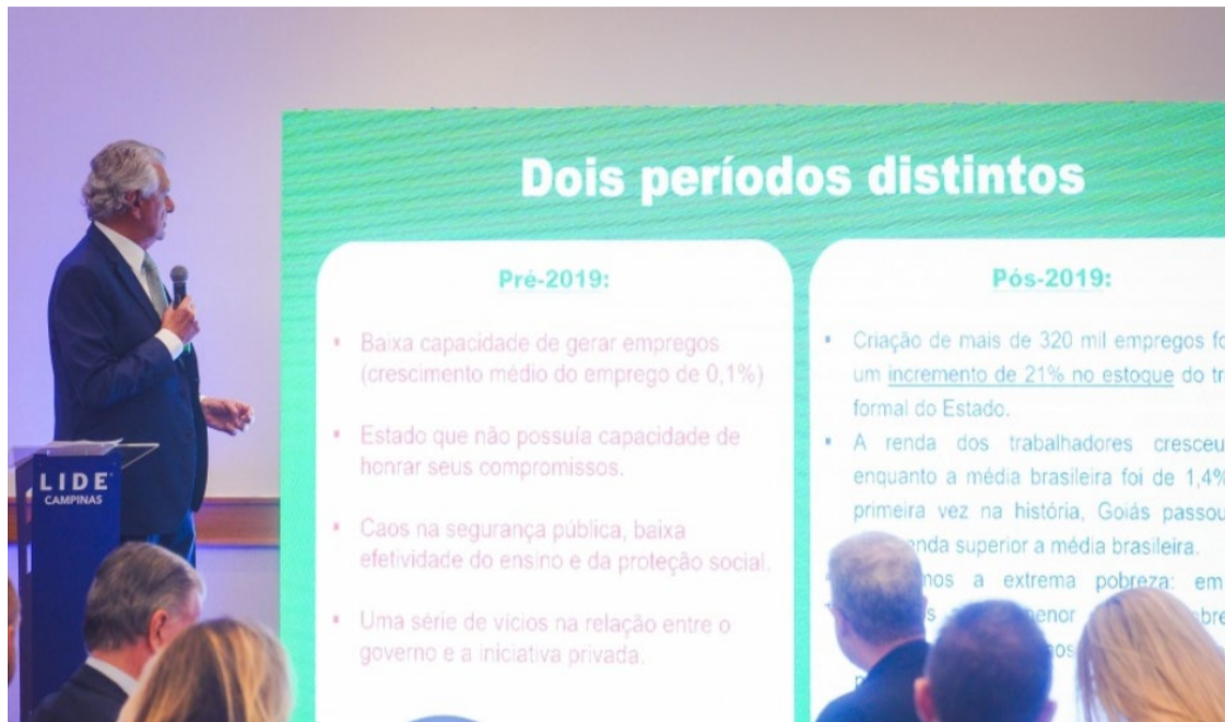
Governador Ronaldo Caiado avalia cenário econômico: segurança jurídica impacta Goiás

A plateia, composta por empresários dos setores de saúde, agronegócio, indústria farmacêutica, educação, comércio, jurídico, automotivo,