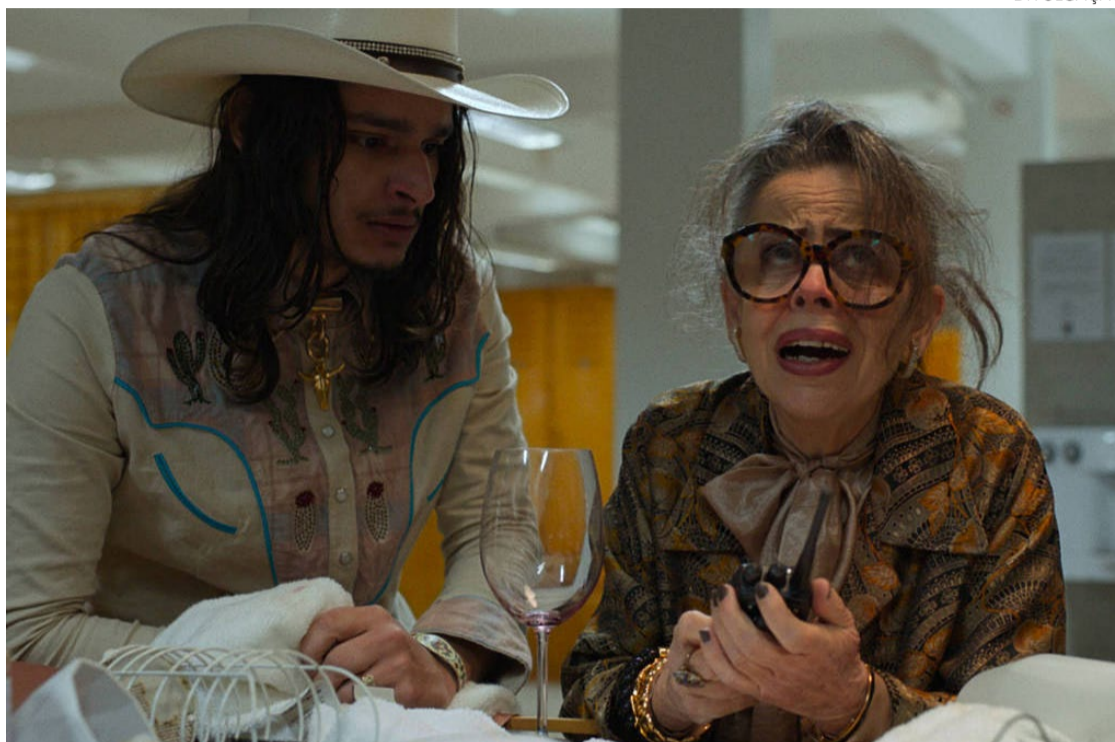
Me Too às avessas: filme vira o jogo ao tratar homens como objetos sexuais

A filmagem da cena mais delirante de "O Clube das Mulheres de Negócios" durou três horas e, segundo ela, foi exaustiva. "Eu nem sei o que aconteceu. Era tanto homem, um de cada lado, outro por cima... Meu Deus!", lembra, aos risos.