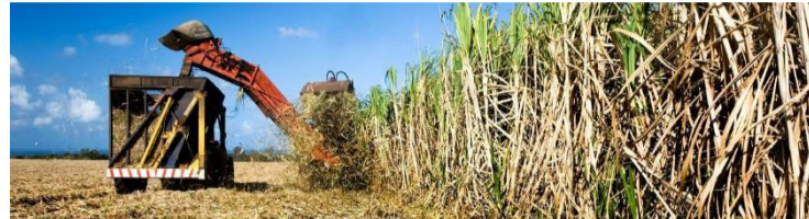
Previsão da produção é de queda de 2,8% em relação à safra anterior, alcançando 79,2 milhões de toneladas

Levantamento Sistemático da Produção Agrícola de julho estima que a área plantada de cana-de-açúcar em Goiás é de 994,9 mil hectares, valor 0,6% menor do que a da safra 2023 (1,0 milhão de hectares)