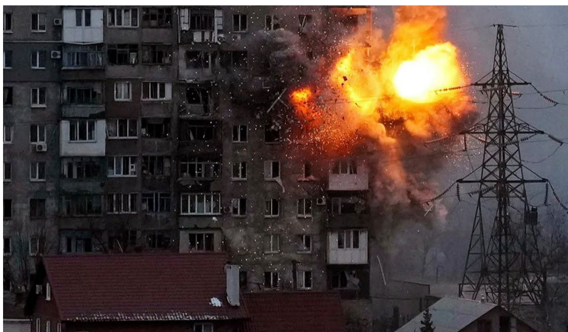
Mstyslav Chernov esteve durante 20 dias sitiado em cidade ucraniana