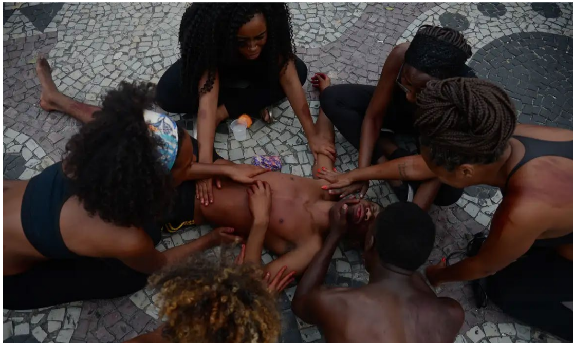
Maioria das vítimas era negra, homem e tinha de 15 a 19 anos

Nos últimos três anos, mais de 15 mil crianças e adolescentes até 19 anos foram mortos no Brasil de forma violenta. Nesse período, cresceu a proporção de mortes causadas por intervenção policial