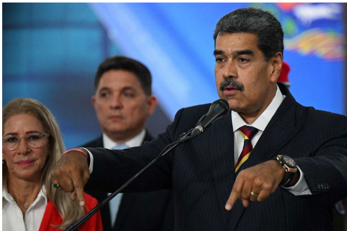
Em discurso recente, Maduro afirmou que as redes sociais contribuem para a instalação do ódio no país

Além disso, o governo venezuelano tem tomado medidas drásticas contra veículos de comunicação internacionais. Por exemplo, o jornal americano Wall Street Journal teve seu acesso bloqueado na Venezuela após publicar uma reportagem crítica ao governo. Essa ação é vista como parte de um esforço mais amplo para controlar a narrativa e limitar o acesso a informações que possam desafiar o regime de Maduro.