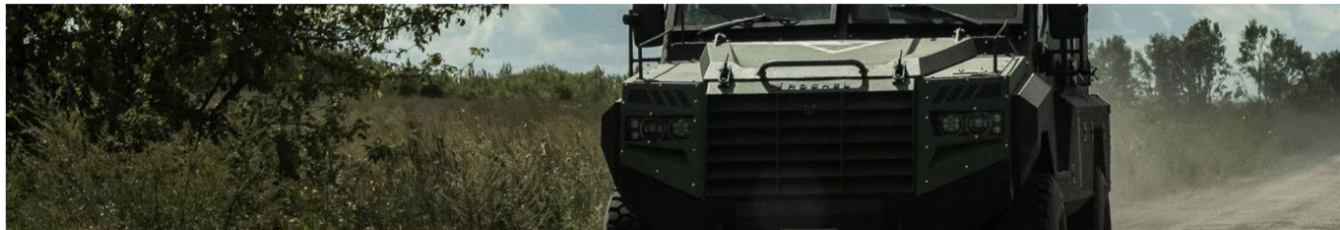
Ofensiva é a maior incursão ucraniana em território russo desde o início da invasão