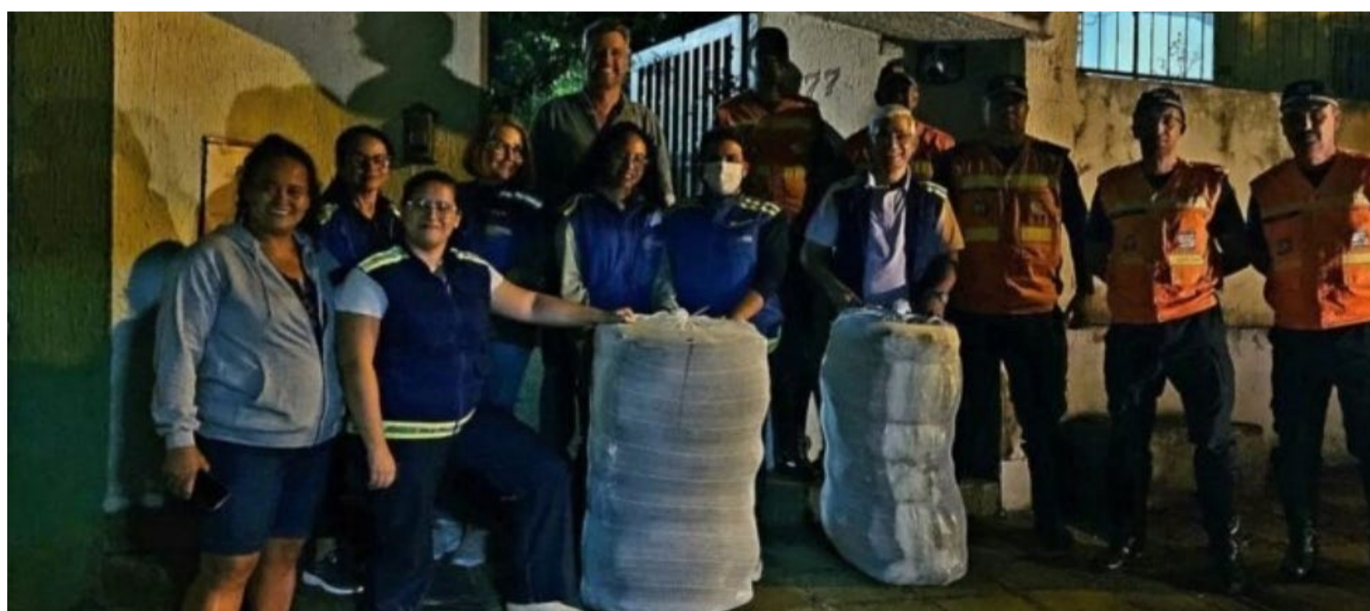
Medida possibilita acolhimento emergencial para pernoite de pessoas em situação de rua

A entrega de cobertores é realizada com o objetivo de proporcionar mais conforto e pro-