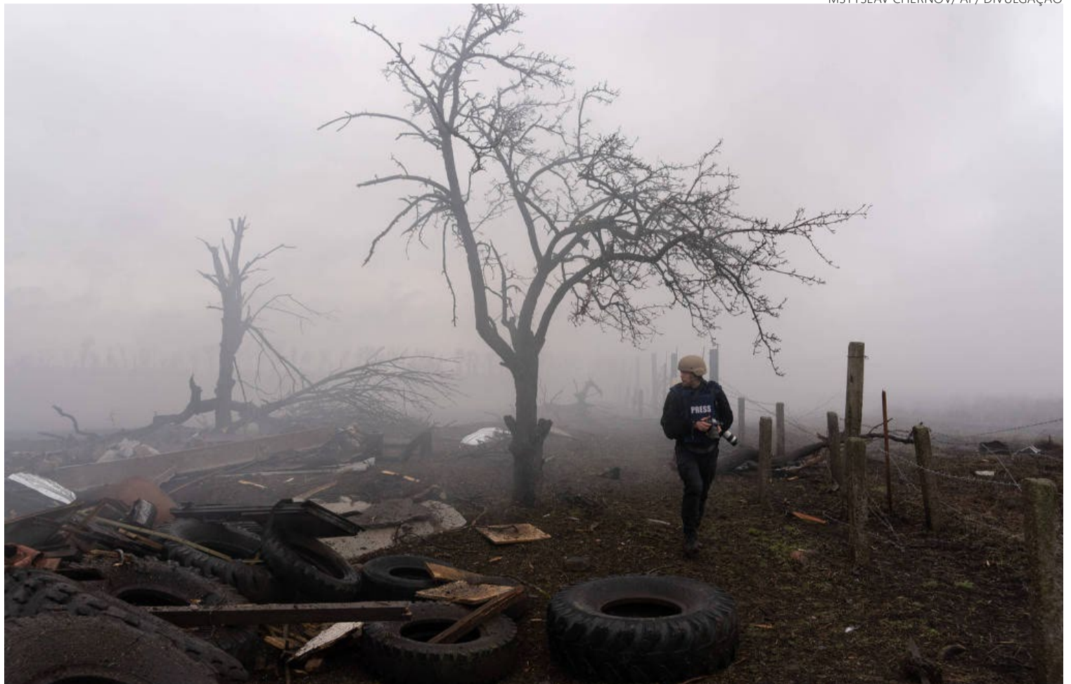
Doc traz pensamentos do repórter entrelaçados às imagens da destruição