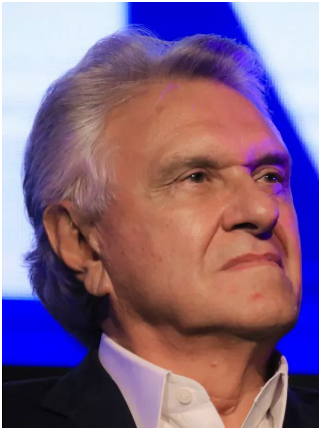
Ronaldo Caiado: falta diálogo do Governo Lula com os governadores

Além das críticas à reforma tributária, Caiado também apontou problemas no sistema de emendas parlamentares impositivas, que têm ocupado uma fatia crescente do Orçamento Público. De acordo com